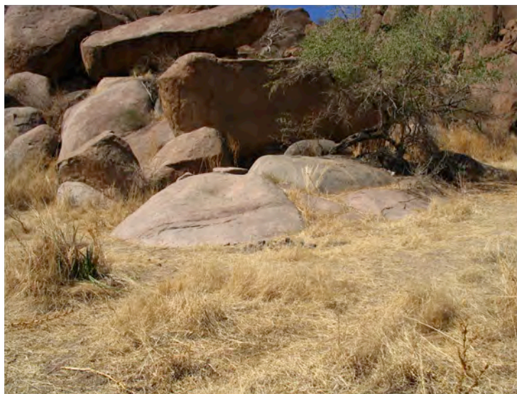
Altari sacrificali

Negli altri testi compaiono nell'iterazione delle sequenze ed azioni le offerte ai defunti: ( nabulà ) tóoda date sono le vivande che vengono lasciate sulla tomba dei defunti, sella (ombra) sekena , è il recipiente della rimembranza, in cui si mette áifā , birra di sorgo, kiina , (il cereale per elezione) e carne ( ñā ) in ricordo del defunto, offerta sacrificale che non viene consumata dai viventi, che - come sottolineano i testi - condividono invece il resto delle carni in una commensalità collettiva. Questo atto dolorosamente rinnovato dura fin alla rimemorazione dell' uga ayfa , che è particolarmente intensa e coinvolgente nel caso della morte di uno zio materno ( imbàa, imbáañā è il mio zio materno 26 ), un anno dopo la morte, atto