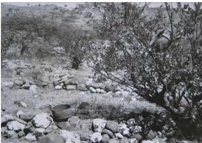
Nabulà . Offerte funebri – Foto di Ezio Tonini

maneggiare con cura che riguarda anche i “resti di umanità”. Lontano dal cimitero comune, e senza pianto e rituali, vanno sepolti anche «coloro che morirono convinti di stregoneria, e quelli che, essendosi resi colpevoli di omicidio nella persona di un compaesano, morirono prima che avesse luogo la vendetta o fosse stato pagato il prezzo del sangue» 13 . Sono esseri umani che non possono essere reintegrati nel corpo sociale, imperfetti, socialmente mancanti. Né i lattanti avranno discendenza né gli stranieri possono produrre discendenza per i Kunama: la reintegrazione delle loro